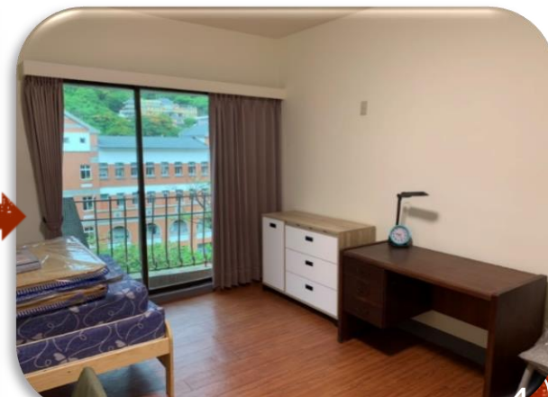
善用既有陳設，新舊搭配打造嶄新風格