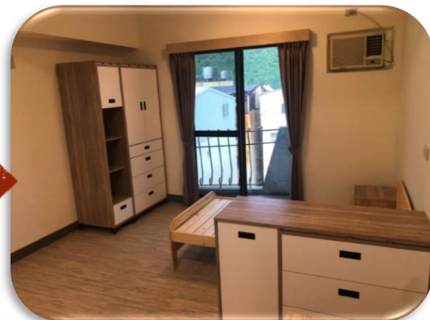
簡約、暖色、木質調，打造溫馨居家風